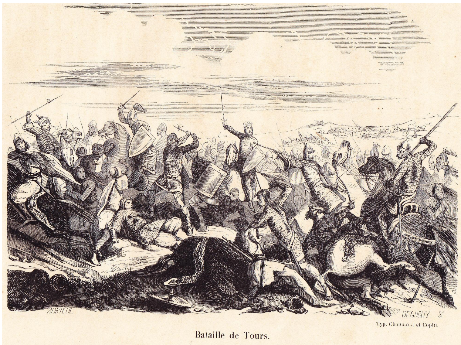
Bataille de Tours.

Dans Histoire de l'armée et de tous les régiments depuis les premiers temps de la monarchie française jusqu'à nos jours (1860, tome I).